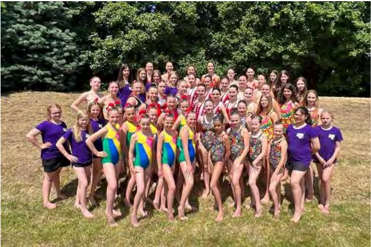
Alle Teilnehmerinnen Hess. MS 2023

Unsere Landesmeisterschaften in der offenen Wertung und den einzelnen Jugendklassen fanden in einem gemeinsamen Wettkampf Anfang Juni im Bezirk Süd statt. Auch an dieser Stelle nochmals ein herzliches Dankeschön dem Ausrichter MTV Urberach, für diese perfekt vorbereiteten Hessischen offenen und Altersklassen-Meisterschaften. Die Aktiven des Ausrichters gingen nur in der Pflicht und in der offenen Wertung an den Start.