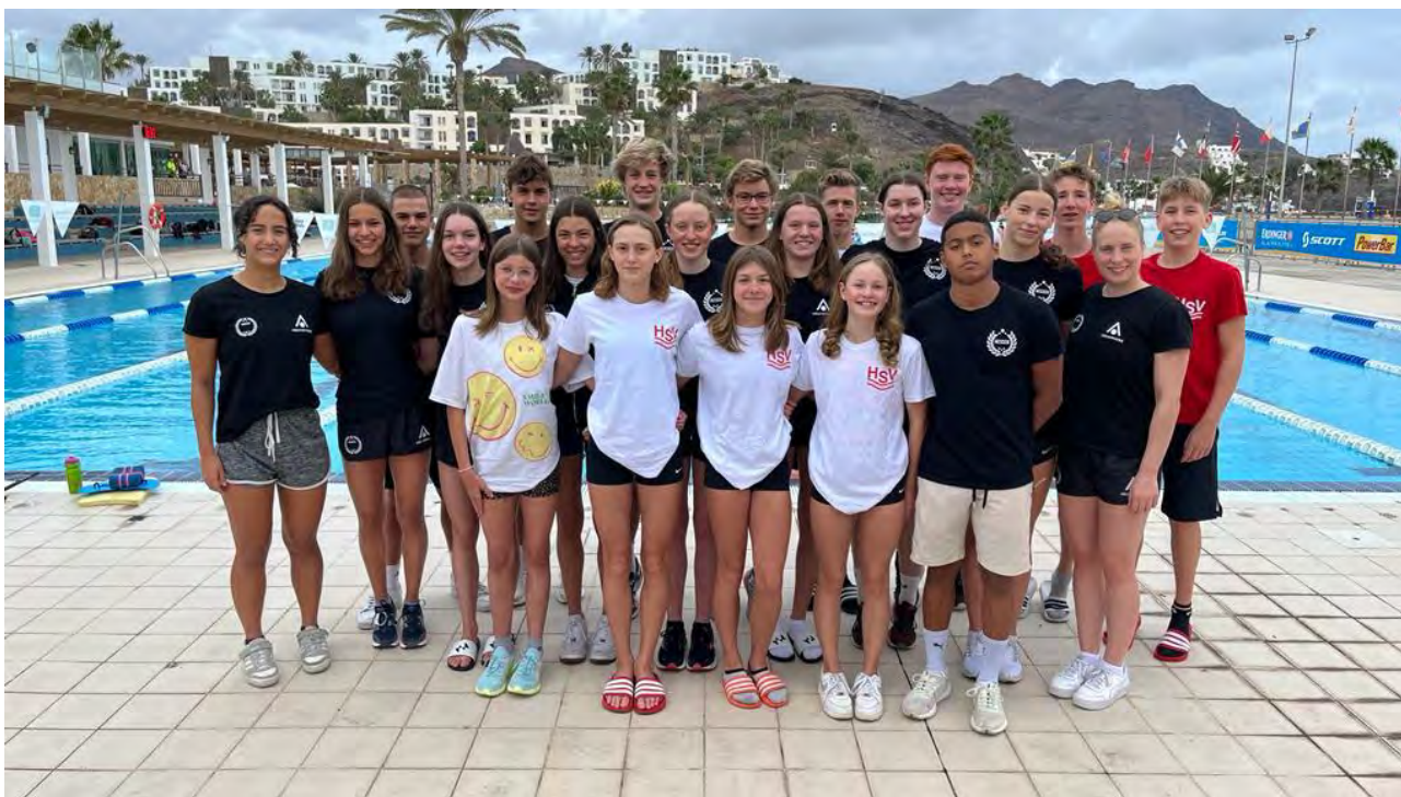
HSV Team auf Fuerteventura

Im Schwimmen startete das Jahr 2023 mit einer Neuerung: Erstmals reiste das HSV Nachwuchs Förderteam zusammen mit dem HSV-Perspektivteam ins Trainingslager nach Fuerteventura. Die Mannschaft setzte sich aus vierzehn Aktiven des HSV-Perspektivteams (Jg. 2005-2007) und acht Aktiven des HSV-Förderteams (Jg. 2008-2010) zusammen. Unter der Leitung von HSV-Landestrainer Ingolf Bender und Stützpunkttrainer Volker Kemmerer (SG Frankfurt) trainierten die Teams teilweise individuell aber auch in einigen Trainingseinheiten gemeinsam. Für das in 2022 neu berufene Nachwuchs-Förderteam war das Trainingslager eine gute Möglichkeit zu erfahren, wie es nach dem Förderteam im HSV für sie weitergehen könnte, wenn sie ihre Leistungen weiterentwickeln können, um sich für das Perspektivteam zu empfehlen.