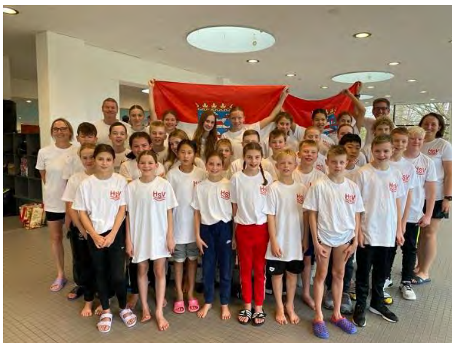
HSV Team beim Süddt. Jugendländervergleich

Im November fand der Süddeutschen Jugendländervergleich in Aschaffenburg statt, an dem der HSV mit 30 Aktiven teilnahm. In der Gesamtwertung belegte der HSV hinter der Auswahl aus Nordrheinwestfalen und Bayern den sehr guten dritten Platz.