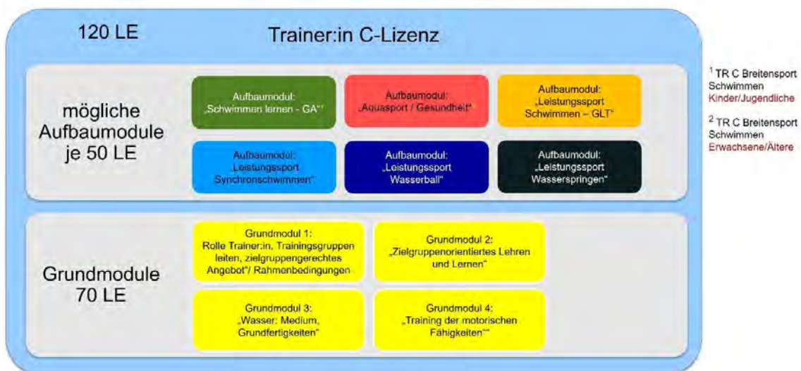
Trainer*innen C Lizenz / Ausbildungsmodule

Insgesamt gilt der Dank einmal mehr allen beteiligten Referent:innen, die mit viel Engagement und Flexibilität der Garant für die erfolgreichen Ausbildungen im HSV sind und nicht zuletzt der Geschäftsstelle für die gute Organisation der Lehrgänge.