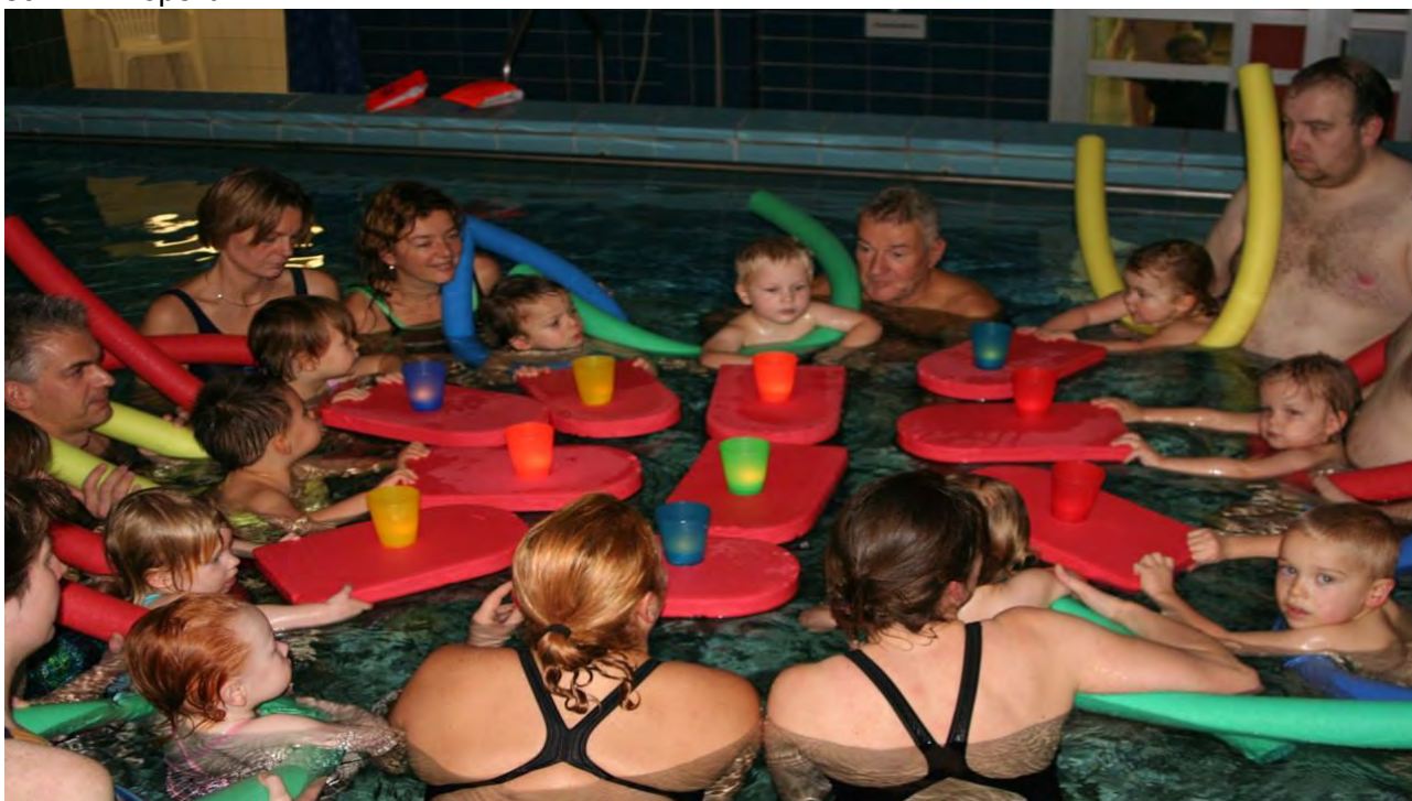
Familien Schwimmen

Als Hessischer Schwimm-Verband gehen wir noch einen Schritt weiter. Unter der Zielstellung eines lebenslangen Bewegens im Wasser haben wir auch im Jahr 2023 wieder eine Ausbildung zum Erwerb der Lizenz Trainer B Bewegungsförderung für Kinder und ihre Familien angeboten. Zu Gast waren wir in diesem Jahr in Fulda. Anknüpfend an die Inhalte der Lizenz Trainer C wird in der zweiten Lizenzstufe der Fokus auf die 0-6-jährigen geworfen. Dabei sind die Niveaustufen 1 (Wassergewöhnung) und 2 (Grundfertigkeiten) die fachlichen Anteile. Sie werden ergänzt durch Lerninhalte über die ganzheitliche Entwicklung des Kindes, mögliche Störfaktoren und die Einbindung der Eltern in den Vereins- bzw. Übungsbetrieb. Hessen ist auch mit diesem Angebot Pionier im Deutschen Schwimmsport.