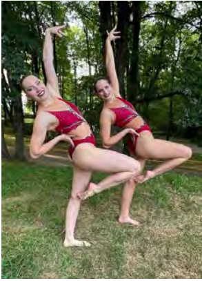
Deutsche Meisterinnen 2023

Einer unserer Wettkampfhöhepunkte im vergangenen Jahr waren einmal mehr die Deutschen Altersklassenmeisterschaften, die Mitte Juni in Remscheid ausgetragen wurden. Auch bei dieser Veranstaltung waren für Hessen der Erste Sodener SC und die Wasserfreunde Fulda am Start.