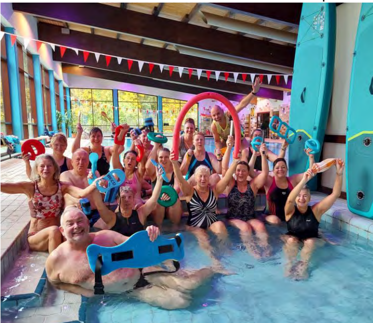
Powerwochenende, Foto: A. Schweigert-John

umfangreiches Lehrmaterial, das von EVELETICS professionell gestaltet und layoutet wird. Lange angekündigt, wird es hoffentlich zu Beginn dieses Jahres sowohl digital wie gedruckt erhältlich sein. Auch hier können wir sagen, dass der HSV Pionierarbeit geleistet hat und darauf hoffen, dass das 150 Seiten Werk den Freizeit- und Gesundheitssport bundesweit voranbringt.